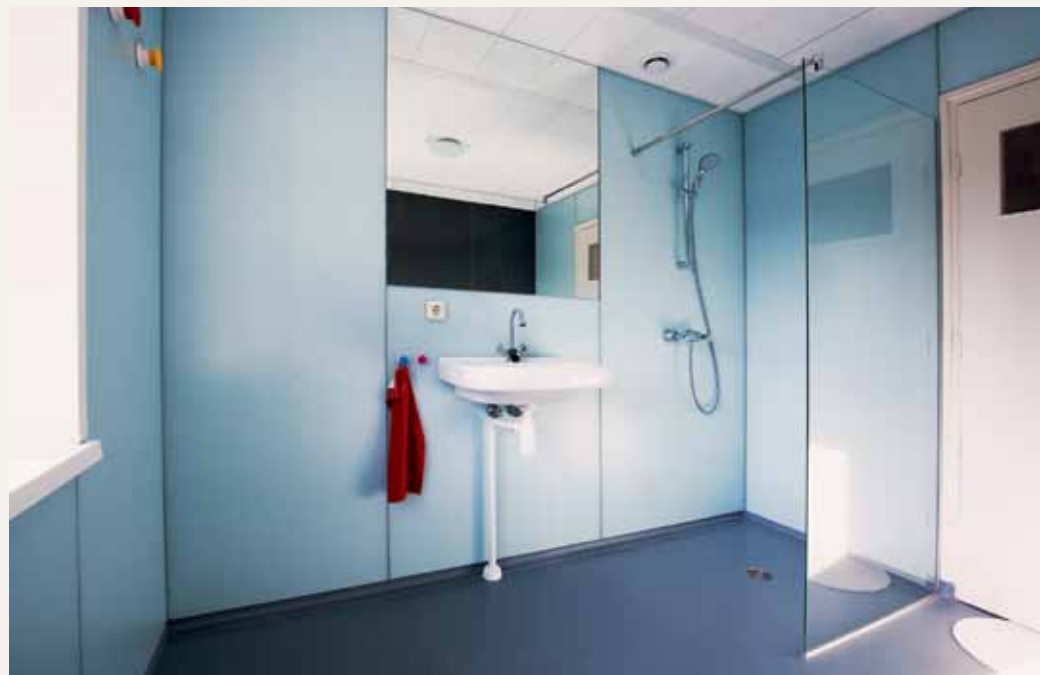
In het kader van de Stroomversnelling renoveert Woningcorporatie Portaal, samen met BAM, in totaal 109 geschakelde woningen uit de jaren zestig in Soesterberg naar 'Nul-op-de-meter'. Beide pilotwoningen zijn opgeleverd. De gevels zijn ontworpen door Wenink Holtkamp architecten. In de woning ligt de nadruk op een snelle uitvoering van technische ingrepen ten behoeve van een energieverbetering, met zo min mogelijk faalkosten.

met veertig procent teruggebracht. 2 Hiervoor is gewerkt met systeemwoningen die door aannemers zijn ontwikkeld. Woonbron: "De grootste investering zit in het uitwerken van een eerste concepthuis: de andere huizen zijn daar een doorvertaling van. (...) Niet steeds opnieuw het wiel uitvinden dus, wat zich vooral uit in een forse besparing op de algemene kosten en adviseurkosten." 3