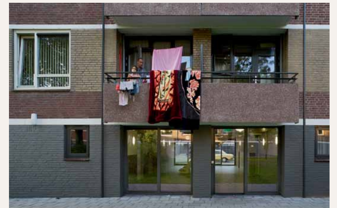
De renovatie van vijf portiekflats uit 1970 in de wijk Schuilenburg te Amersfoort is door Van Schagen Architecten uitgevoerd in opdracht van de Alliantie. De technische opgave betrof het verbeteren van de energieprestatie en het vervangen van afgeschreven ramen en hekwerken. Door de entrees te verbreden en tot aan de achterzijde door te breken, is een ruime entreehal gecreëerd die toegang biedt tot het achterliggende groengebied.