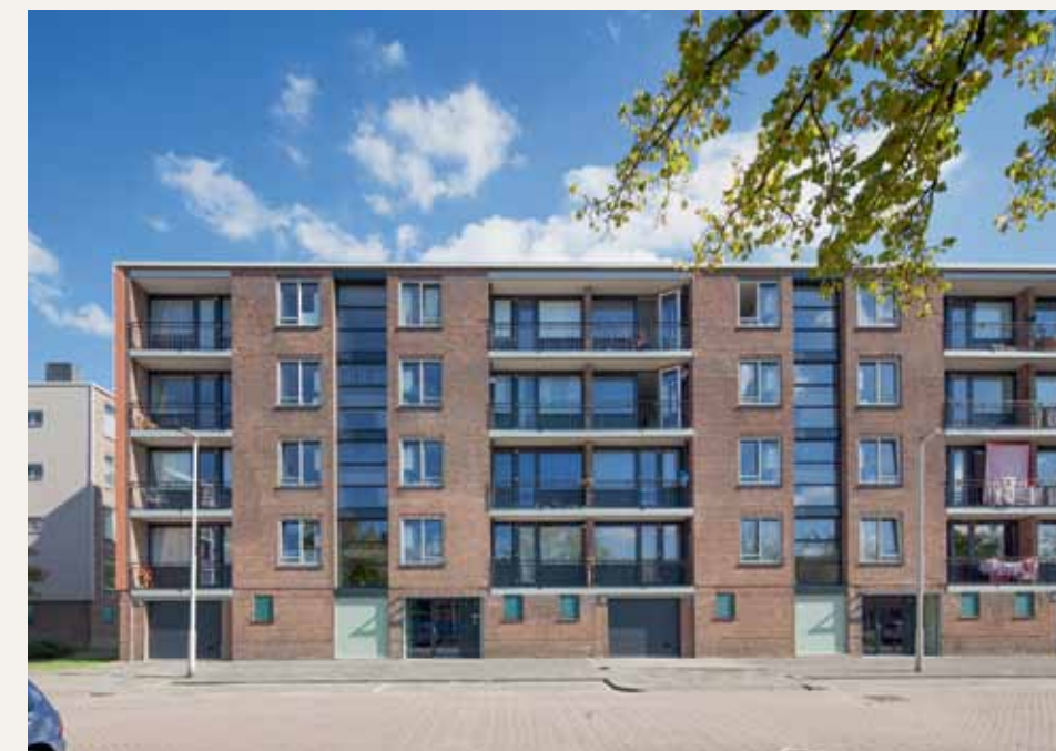
In complex 208 in Rotterdam zoekt HP Architecten de toegevoegde waarde in slimme oplossingen.

inkomsten op koopwoningen. Nu de commerciële ontwikkelactiviteiten aan banden zijn gelegd, moeten corporaties op zoek naar andere modellen om te voorzien in de grote behoefte aan goede en betaalbare woningen. Een voorbeeld van zo'n nieuw model is het 'Prachthuis' van Woonbron. Dit is volgens hen "een ruime en kwalitatief hoogwaardige nieuwbouweengezinswoning voor het sociale huursegment". Deze woningen worden zonder onrendabele top gerealiseerd. "Iets wat tot voor kort ondenkbaar was in de corporatiewereld", aldus Woonbron. De eerste Prachthuizen zijn in januari 2015 in Hoogvliet opgeleverd. Waarover net als bij de hierboven geschetste verduurzamingsprojecten in de communicatie vooral wordt gerept, is het behaalde resultaat in termen van tijd en geld: met een bouwtijd van vier maanden is de uitvoeringsfase met 65 procent ingekort en zijn de bouwkosten