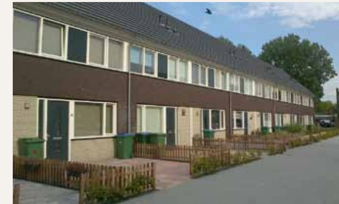
Het Prachthuis is een nieuw concept van Woonbron. Dit is een eengezinswoning voor het socialehuursegment, die zonder onrendabele investering kan worden gerealiseerd. De Prachthuizen bieden bestaande bewoners, ook als hun inkomen stijgt, de mogelijkheid om binnen hun wijk naar een meer geschikte woning te verhuizen. In de komende vijf jaar hoopt Woonbron in Rotterdam, Dordrecht en mogelijk ook Delft enkele honderden Prachthuizen te realiseren.

Woningbouwopgaven die in eerste instantie puur bouwkundig lijken,